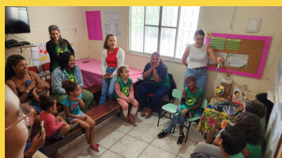
Casa Semente - RJ