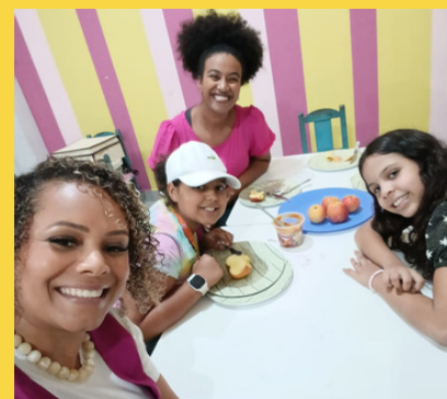
Itabira - MG