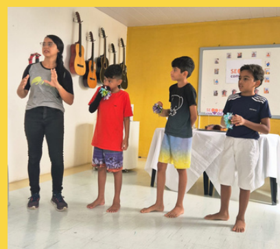
Jocum Natal - RN