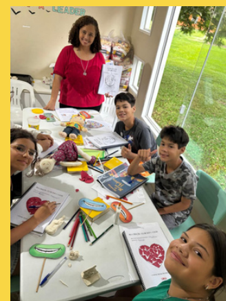
Jocum Curitiba - PR