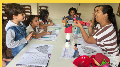
Viçosa - MG

Ao longo do ano de 2025, tivemos seis grupos realizando as oficinas do programa Sempre Com Você - direcionado à ajudar crianças a lidar de maneira saudável com o luto - em quatro estados diferentes (RJ, MG, RN e PR).