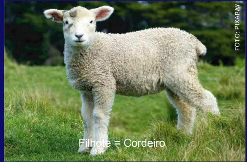
Filhote = Cordeiro